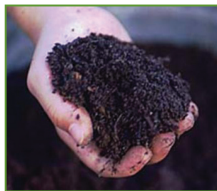
Figura 3. Humus listo para usarse en el jardín.

Cuando los microorganismos empiezan a descomponer la materia orgánica se genera calor. En unos pocos días, la pila de compostaje puede alcanzar una temperatura de 90 a 160 °F. Este proceso de calentamiento destruye la mayoría de las semillas de malezas, huevos de insectos y organismos