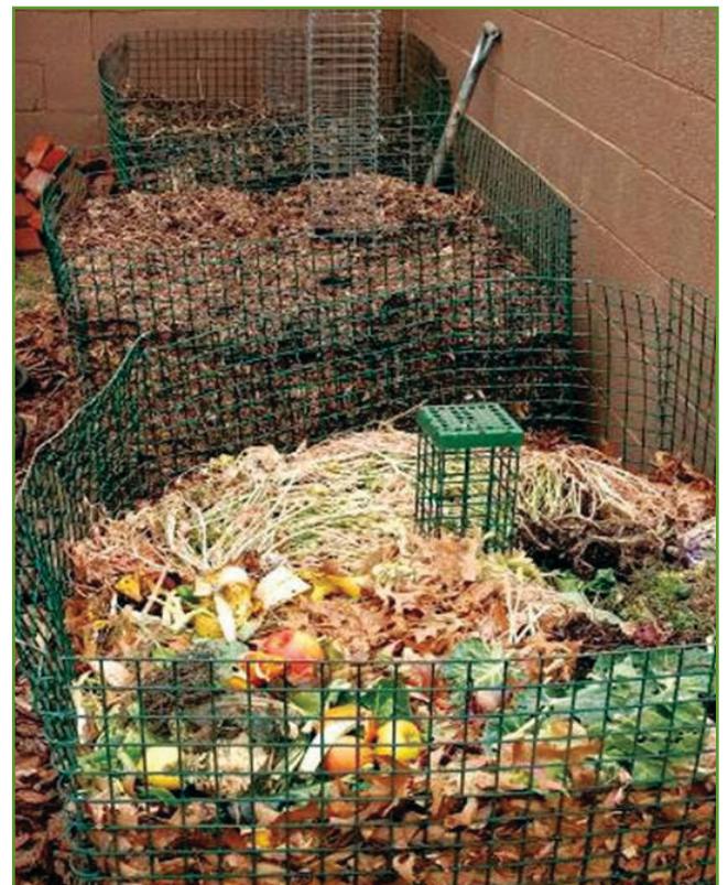
Figura 4. Contenedores de composta.

El compostaje se puede hacer directamente en el suelo, de preferencia donde se van a levantar y plantar los surcos en la siguiente temporada de crecimiento, una vez que los materiales estén completamente descompuestos.