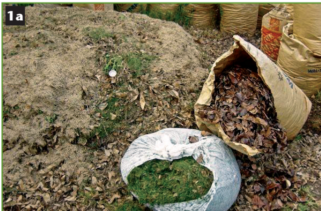
Figura 1. Los recortes de pasto y hojas hacen una buena composta (1a). Las hojas se descomponen más fácilmente si son picadas antes de agregarse a la pila de compostaje (1b).