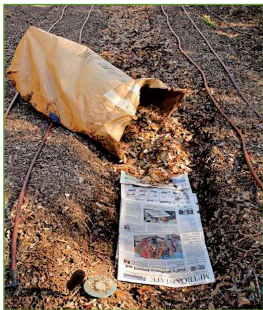
Figura 5. Después de hacer un hueco rellenar con papel periódico y hojas secas.