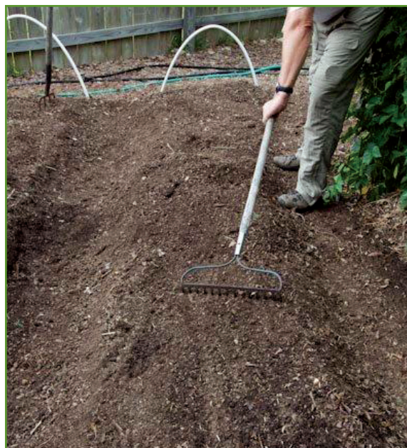
Figura 7. Después de unos meses voltee el suelo donde ha estado la composta. Esta listo para ser usado.