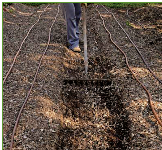
Figura 6. Cubra el material para compostar con la tierra que estaba en el hueco.