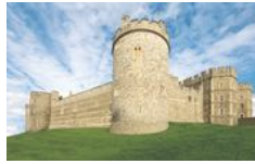
Los mejores castillos del mundo

Read this article in English: How to Make Water-Soluble Essential Oil