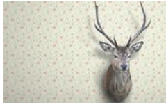
Tapices sin límites