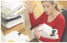
10 maneras de mejorar el estrés en menos de 5 minutos